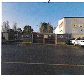
Déchetterie du port de pêche