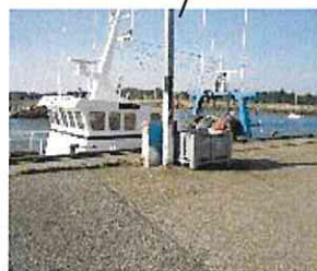
Bacs de collecte