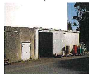
Local huile et filtres