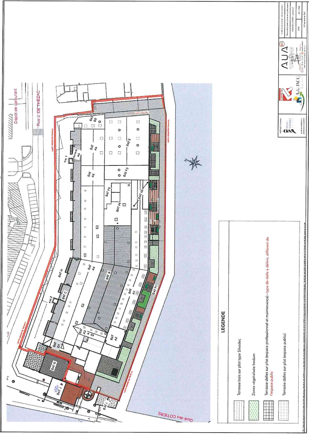
ANNEXE 2 – Plan de traitement architectural du belvédère de la criée du port du Guilvinec-Léchiagat