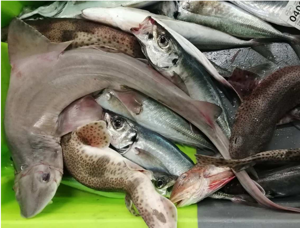
Cr ee du Guilvinec