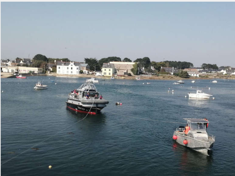
Convoyage du bateau-pousseur - 17 sept 2020