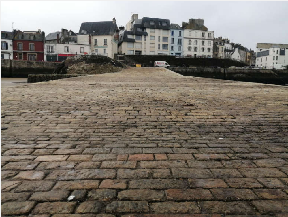
La cale Raie, Douarnenez/Rosmeur