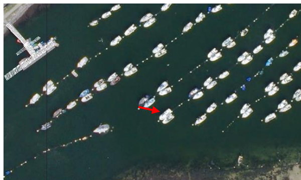
● Place E01T